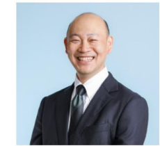
福祉用具業界から参入 有限会社 ハートサービス