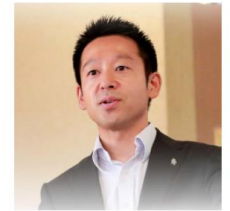
飲食業界から参入 夢成 株式会社