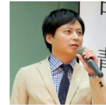
健康食品業界から参入 株式会社ローズメイ