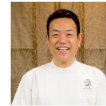
接骨院から参入 株式会社Healing Hand