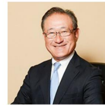
建築業界から参入 株式会社ササキハウジング カンパニー