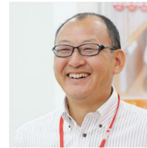
建築業界から参入 株式会社ベストホーム