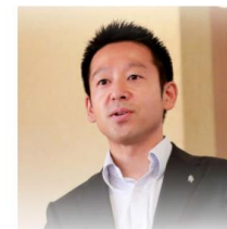
飲食業界から参入 夢成 株式会社