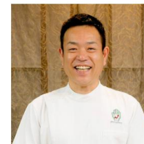
接骨院から参入 株式会社Healing Hand