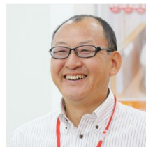
建築業界から参入 株式会社ベストホーム