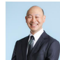
福祉用具業界から参入 有限会社 ハートサービス