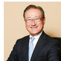
建築業界から参入 株式会社ササキハウジング カンパニー