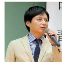
健康食品業界から参入 株式会社ローズメイ