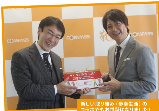
新しい取り組み（歩幸生活）の コラボでもお世話になりました！